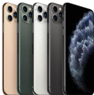
iPhone 11 Pro Max