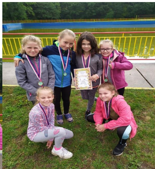
Naši úspěšní sportovci 😊