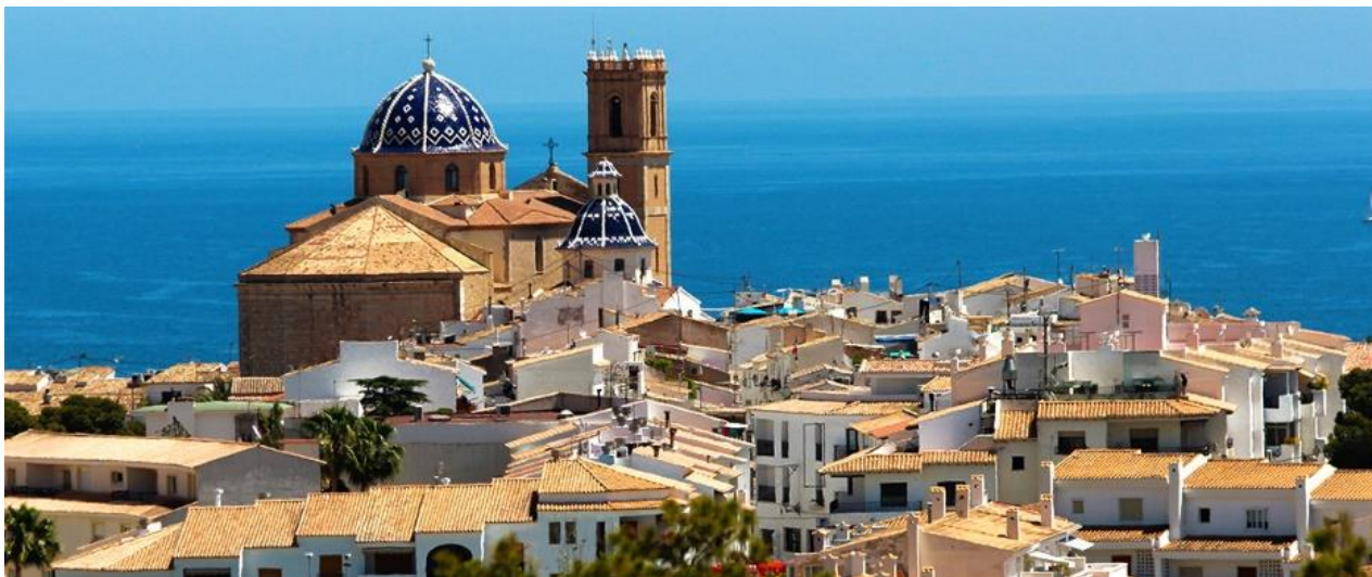
Aneta Jandová, 9. C

Den před odletem jsme jeli opět do Alicante, kde jsme spali v hotelu BB, jelikož jsme na letišti museli být v pět hodin. Po příjezdu na letiště jsme čekali zhruba 3 hodiny, než nás pustí k odbavení zavazadel. No a potom už hurá domů.