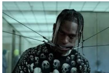
TRAVIS SCOTT- HIGHEST IN THE ROOM