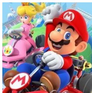
Mario Kart Tour