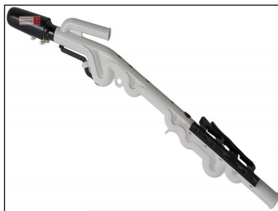
Jeden z prezentovaných hudebních nástrojů